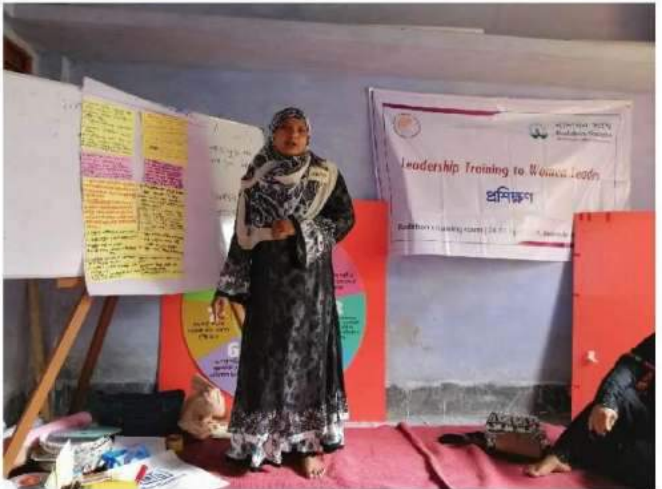
প্ৰশিক্ষণ মডিউল : জুমি ও জলাশয়ে নাৰী নেতৃত্ব

এবপৰ সহায়ক সবাইকে ধন্যবাদ জানিয়ে বক্তব্যেৰ মাধ্যমে প্ৰশিক্ষণেৰ সমাপ্তি ঘোষণা কৰবেন।