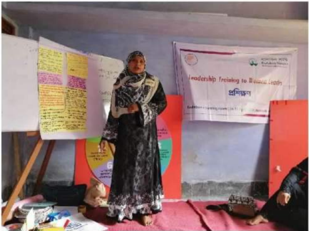
Training Module On Feminist Leadership on Lands and Water-bodies.

Finally, the facilitator will thank everyone present in the session and end the training with a concluding speech.